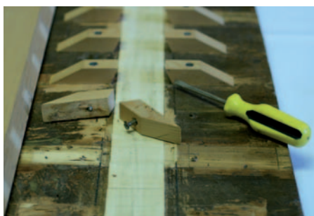
La tavola prima del restauro e le fasi relative alla sostituzione delle traverse sul retro dell'opera